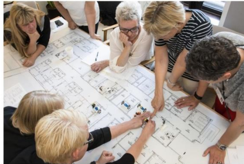
En voksdug med tryk af grundplanen for den nye Akutafdeling giver et godt overblik over, hvordan tingene